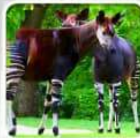
Parc National de Virunga